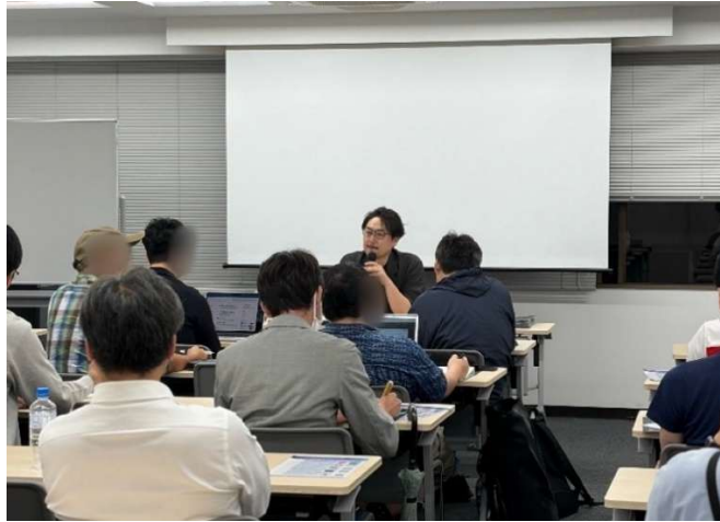
質問ブースの様子